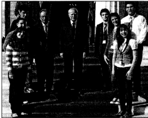
Οι εκπαιδευτές της Βουλής των Εφήβων σε αναμνηστική φωτογραφία με τον Πρόεδρο της Δημοκρατίας Κ. Παπούλια και τον πρόεδρο της Βουλής Δ. Σουφρά (επίσημο) και στελέχη από τις διαδικασίες (κάτω)

Στη ΙΒ' Σύνοδο οι «έφηβοι βουλευτές» εντός από το φαινόμενο της διαφθοράς πολιτικών και ΜΜΕ, αναεξέλεγκτη στα ζητήματα θέματα, της εισβολής των δύο φίλων, των αν-