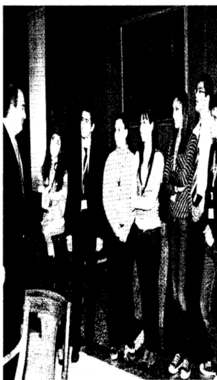
Τα μηνύματα των εφήβων βουλευτών απεικονίζουν τις ανησυχίες της νέας γενιάς για το μέλλον.

Καλωσορίζοντας τους εφήβους, στην Ολομέλεια, ο κ. Σιούφας τους προέτρεψε να μην χρησιμοποιήσουν ξύλινο λόγο και τόνισε ότι ο κόσμος προχωράει και πρέπει να πάμε πιο μπροστά. Οι ευχές δεν φτάνουν. Χρειάζεται η συμμετοχή όλων μας και ε-