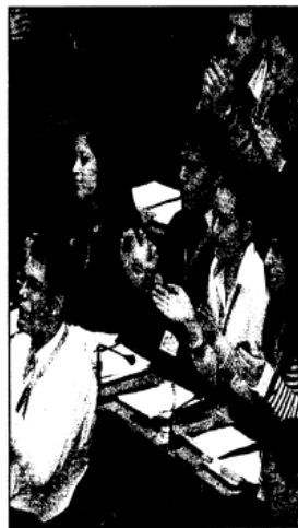
Μαθητές που συμμετέχουν στη Βουλή των Εφήβων παρακολουθούν την Ολομέλεια της 1B' Συνόδου