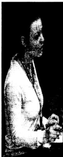
Μαθήτρια που συμμετέχει στη Βουλή των Εφήβων μιλά στη 1B' Σύνοδο παρουσία του Προέδρου της Δημοκρατίας Κάρουλου Παπούλια και του πρωθυπουργού Κώστα Καραμανλή

Εντυπο:ΑΔ. Τυπος (ΡΙΖΟΣ), Σελίδα:6.Α4 - Ημερομηνία:21/1/2008