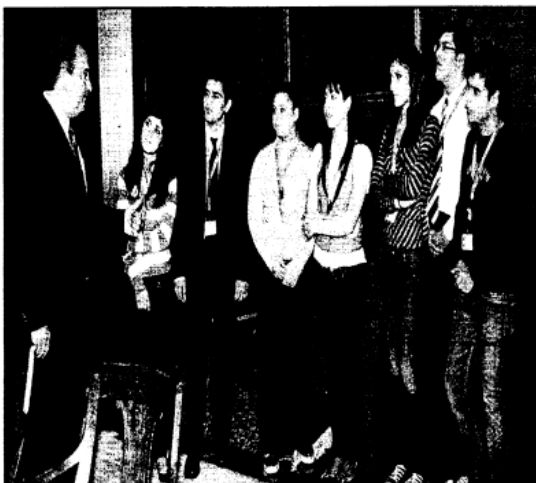
Ο πρωθυπουργός Κώστας Καραμανλής με αντιπροσωπεία από τους μαθητές - «εφήβους βουλευτές» που τον επισκέφθηκαν στο γραφείο του

Να αναφερθεί ότι στο διάλειμμα των εργασιών της Ολομέλειας, οι έφηβοι βουλευτές συναντήθηκαν και φωτογραφήθηκαν με τον με τον Πρόεδρο της Δημοκρατίας, Κάρουλο Παπούλια, καθώς και με τον πρωθυπουργό, Κώστα Καραμανλή, στο γραφείο του στη Βουλή. Εκεί συνομίλησε μαζί τους, τους ευχαρίστησε για την επίσκεψή που του έκαναν και τους καλωσόρισε στη Βουλή, «στην καρδιά της Δημοκρατίας», όπως χαρακτηριστικά ανέφερε.