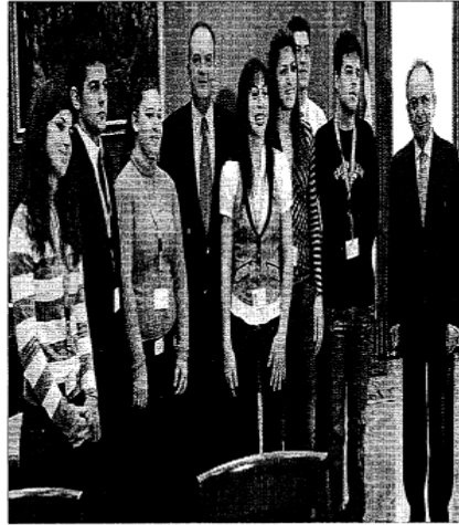
Ο πρωθυπουργός, Κώστας Καραμανλής, και ο πρόεδρος της Βουλής, Δημήτρης Σιούφας, με μελητές της Βουλής των Εφήβων.

Μετά το πέρας της χθεσινής συνεδρίασης της Βουλής των Εφήβων, ο πρωθυπουργός, παρουσία και του προέδρου της Βουλής Δημήτρη Σιούφα, συναντήθηκε στο γραφείο του στη Βουλή με αντιπροσωπεία εφήβων βουλευτών, προς τους οποίους μεταξύ άλλων, αφού τους καλωσόρισε και τους συνεχάρη για τις τοποθετήσεις τους, τόνισε τα εξής: «...Μπράβο σας! Να πω μια λέξη μόνο ότι αυτός ο θεσμός που