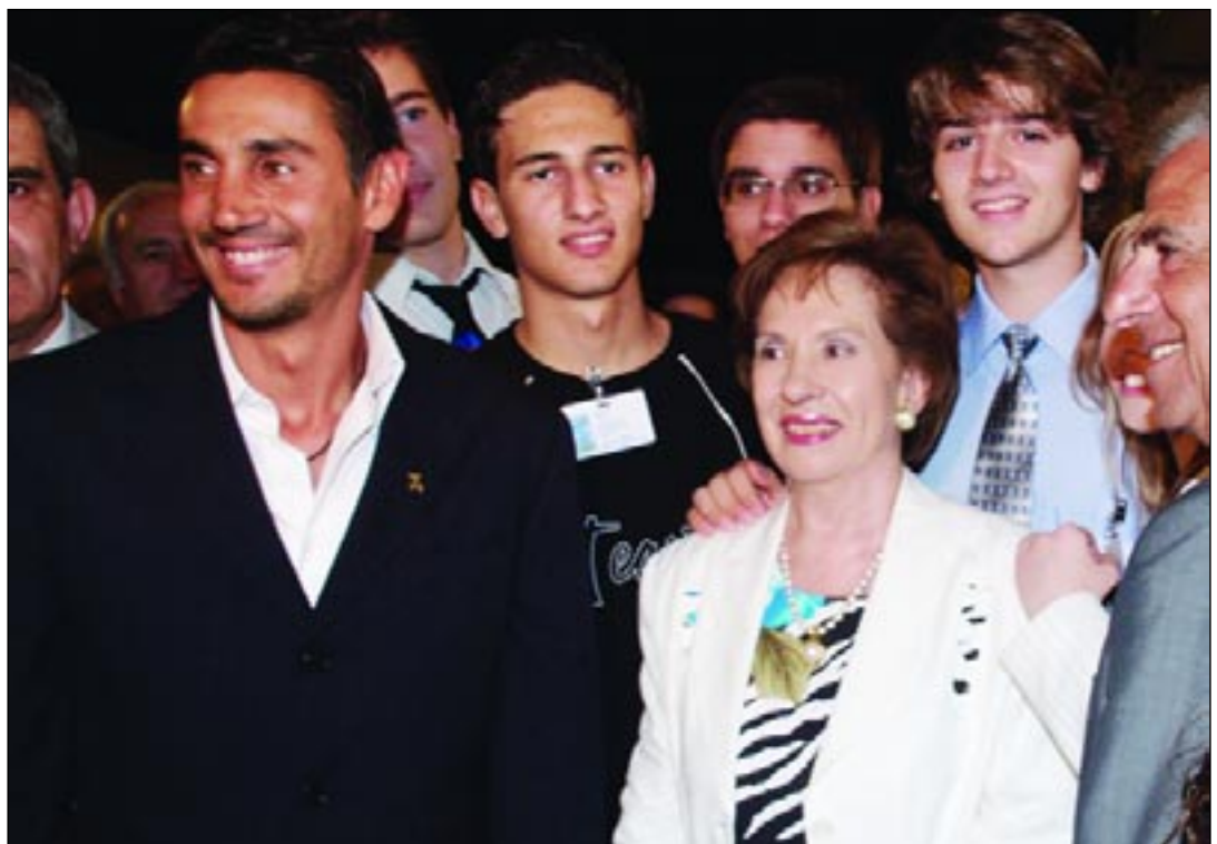
Στιγμιότυπο από τη Δεξίωση που παρέθεσε η Βουλή των Ελλήνων στο πλαίσιο του Προγράμματος «Βουλή των Εφήβων» και στην οποία παρευρέθηκαν Έλληνες Ολυμπιονίκες.