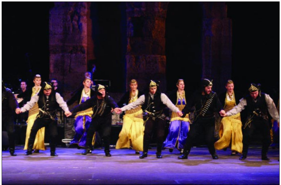
Πέντε χιλιάδες θεατές παρακολούθησαν τη μουσικοχορευτική εκδήλωση του Λυκείου των Ελληνίδων στο Ωδείο Ηρώδου του Αττικού (10/9/2004).