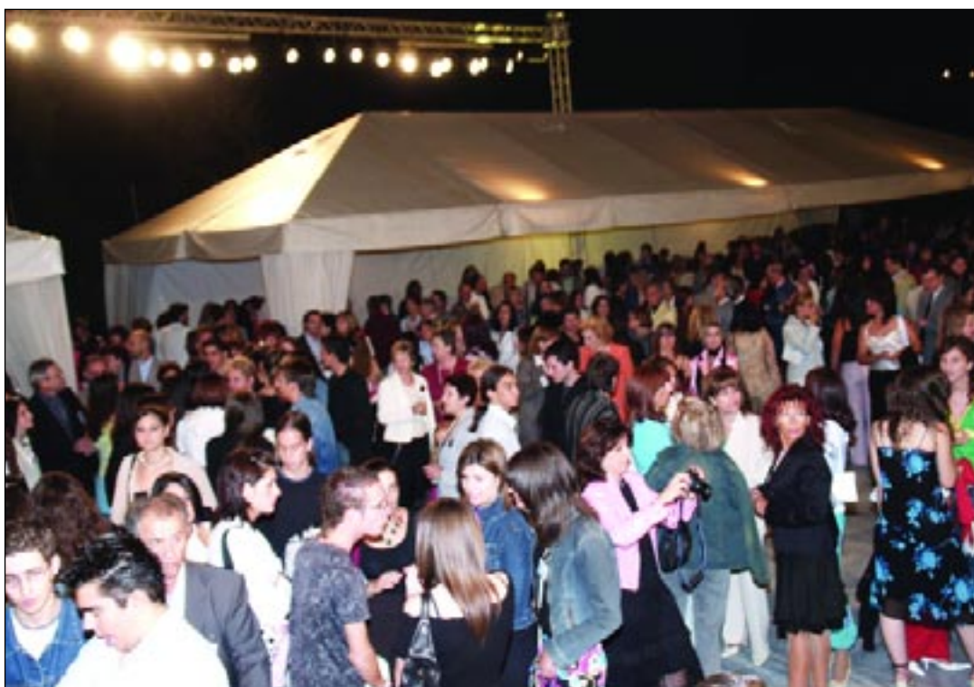
Χαρούμενο στιγμιότυπο από τη δεξίωση που δόθηκε προς τιμήν των «Εφήβων Βουλευτών» της Θ' Συνόδου στο προαύλιο του κτιρίου του Κοινοβουλίου.