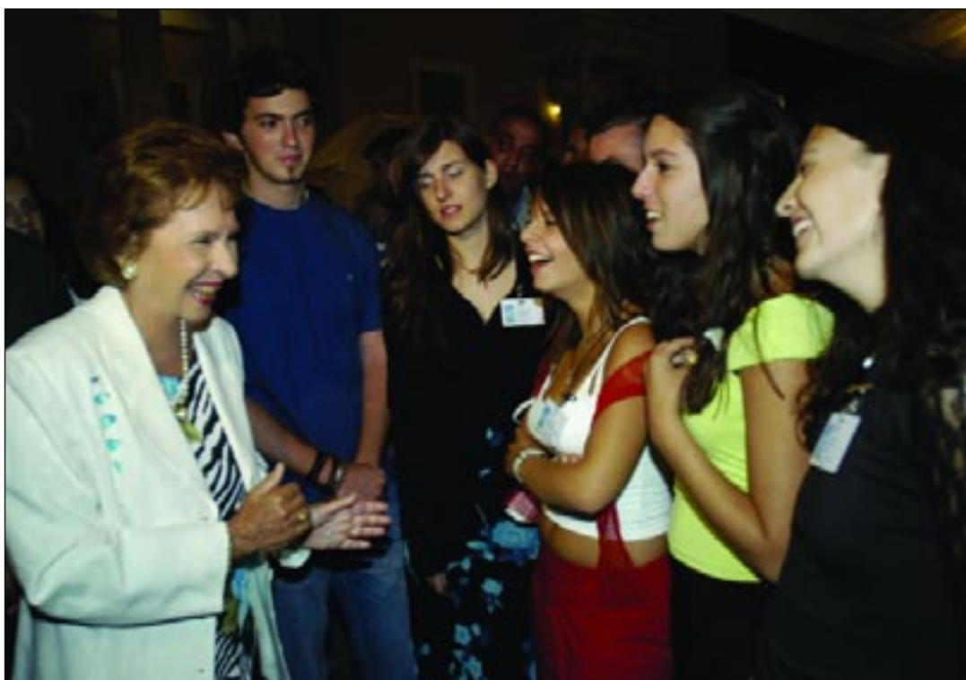
Η Πρόεδρος της Βουλής κ. Άννα Μπενάκη-Ψαρούδα ανάμεσα σε νέους και παλαιούς «Εφήβους Βουλευτές» στη δεξίωση που δόθηκε προς τιμήν τους στο προαύλιο του κτιρίου του Κοινοβουλίου.