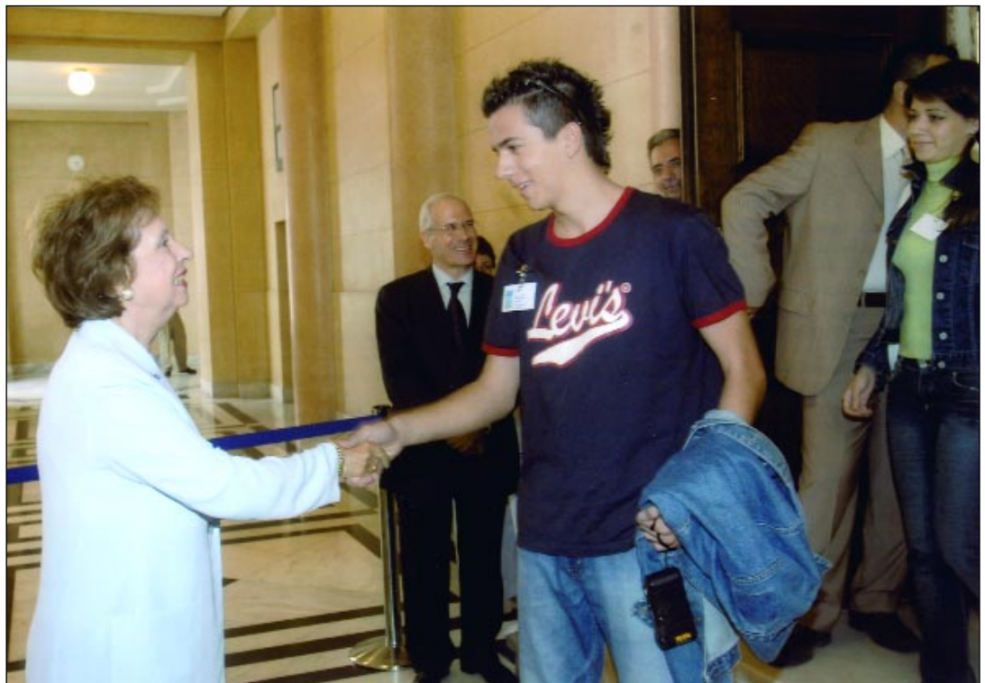
Η Πρόεδρος της Βουλής κα. Άννα Μπενάκη - Ψαρούδα προσφέρει αναμνηστικά και εκδόσεις της Βουλής στους 350 «Έφηβους Βουλευτές» μετά τη λήξη των εργασιών της Θ' Συνόδου της «Βουλής των Εφήβων».