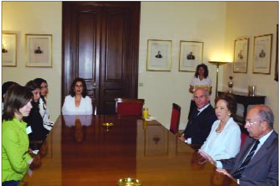
Στιγμιότυπο από την επίσκεψη των εισηγητών των Επιτροπών της «Βουλής των Εφήβων» στον Πρόεδρο της Δημοκρατίας κ. Κωνσταντίνο Στεφανόπουλο.