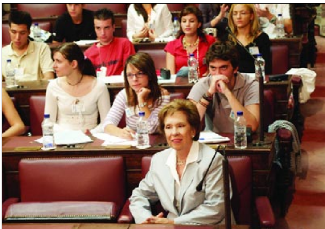
Η Πρόεδρος της Βουλής κ. Άννα Μπενάκη-Ψαρούδα παρακολουθεί Συνεδρίαση των Επιτροπών της «Βουλής των Εφήβων».