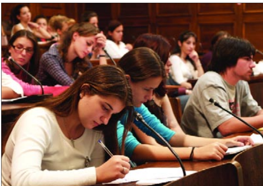
«Έφηβοι Βουλευτές» στις συνεδριάσεις των Επιτροπών της «Βουλής των Εφήβων».