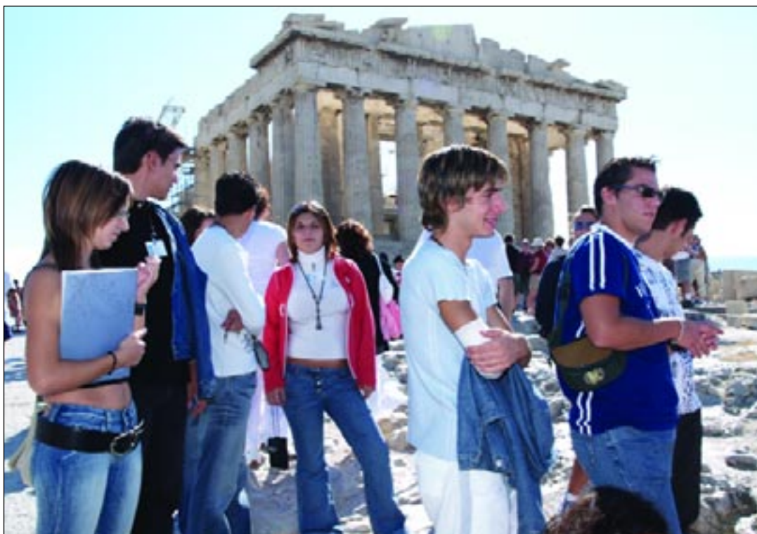
«Εφηβοι Βουλευτές» ξεναγούνται στα μνημεία της Ακρόπολης.