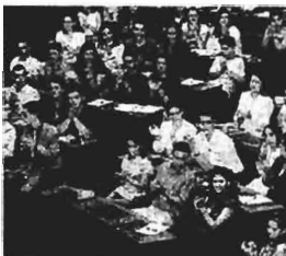
Ο Πρόεδρος της Δημοκρατίας, Κωστής Στεφανόπουλος, χειροκροτεί τους νέους για το πάθος τους και τη φαντασία τους. Δίπλα του, ο Αντιπρόεδρος Σημάκης.

Ο κ. Στεφανόπουλος τόνισε πως θα πρέπει άμεσα να μπει λουκέτο σε όλα τα φροντιστήρια. Ο Κ. Σημίτης απευθυνόμενος στους έφηβους βουλευτές προέβλεψε πως η ένταξη της Κύπρου στην Ευρωπαϊκή Ένωση θα έχει ολοκληρωθεί πριν από το τέλος του χρόνου.