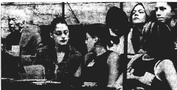
Ο συγγραφέας Αντώνης Σαμαράκης, εμπνευστής του θεσμού της «Βουλής των Εφήβων», παρακολουθεί τις ομιλίες των βουλευτών από τα έδρανα

Ποιοι είναι όμως, αλήθεια, για τους μαθητές τρομοκράτες; «Όπως καταζη-