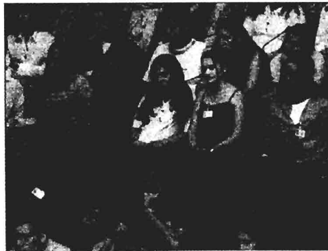
Η Ολομέλεια της Ζ' Συνόδου της "Βουλής των Εφήβων" πραγματοποιείται την προεσχί Τετάρτη, 18 του μηνός, και θα μεταδοθεί απ' ευθείας από την ΕΡΤ καθώς και από το διαδίκτυο, στην ιστοσελίδα της Βουλής ( www.parliament.gr ).

Η επιτυχία και η ευρύτερη αποδοχή του προγράμματος αποτυπώνεται και στη δημοσκόπηση της ΜΡΒ που διεξήχθη τον περασμένο Ιούλιο, όπου το άθροισμα των πολύ θετικών γνώμων για τη "Βουλή των Εφήβων" ανήλθε σε ποσοστό 68,9%, ενώ οι αρνητικές γνώμες ήταν μόλις το 4,3%.