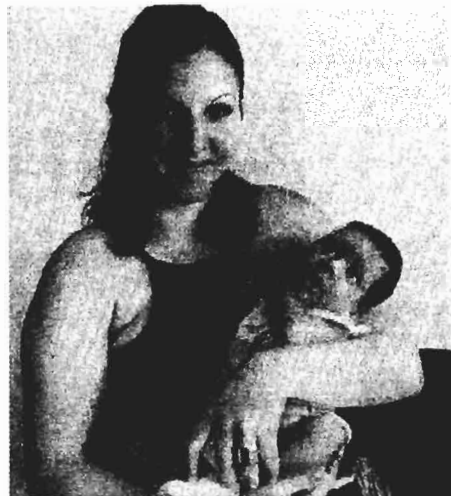
ΕΘΝΟΣ ΤΗΣ ΚΥΡΙΑΚΗΣ, 15.9.2002

Μίλησε στη Βουλή των εφήβων για τον χαμό του πατέρα της και τώρα μιλά για τον ερχομό του γιου της