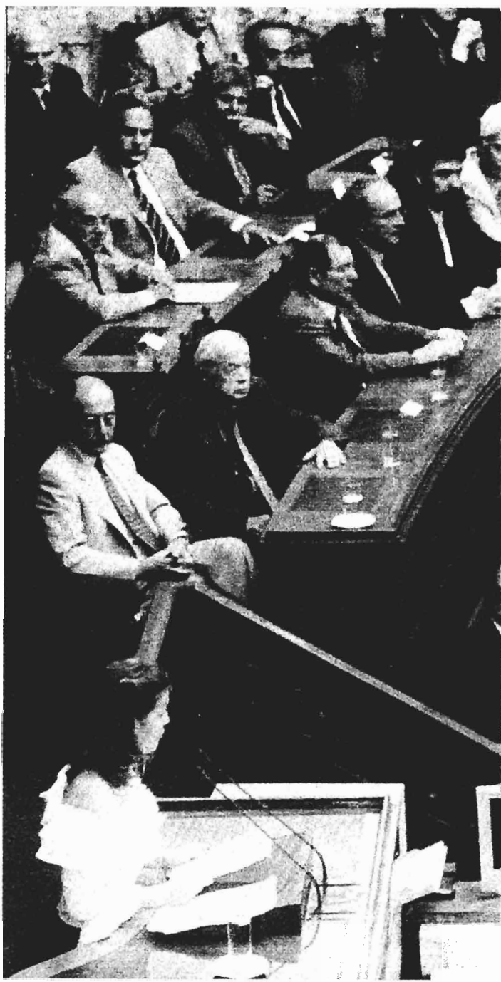
Από το βήμα της Βουλής και υπό τα βλέμματα του Προέδρου της Δημοκρατίας κ. Κ. Στεφανόπουλου (πρώτος αριστερά), αρχηγών κομμάτων και βουλευτών ομιλεί, χθες, έφηβη βουλευτής

Ευδιάθετος εμφανίστηκε και ο κ. Σημίτης κατά τη συνάντησή του με τους νέους στο γραφείο του στη Βουλή και τους εντυπωσίασε καθώς γνώριζε τι είπαν στην Ολομέλεια. Ο Πρωθυπουργός αφιέρωσε αρκετό χρόνο για να απαντήσει στις ερωτήσεις τους και τους... ενημέρωσε για το Κυπριακό: « Η ένταξη της Κύπρου ελπίζουμε να κλείσει επί δανικής προεδρίας και εμείς να αναλάβουμε τη σκυτάλη της προεδρίας για να υπογράψουμε στο τέλος Μαρτίου ή περί τα μέσα Απριλίου του 2003 στην Αθήνα τη συνθήκη προχώρησης της Κύπρου στην ΕΕ ».