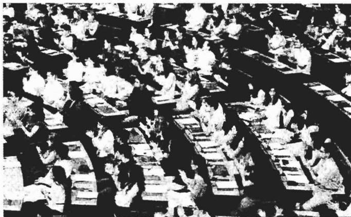
Εληξαν χθες οι εργασίες της 7ης Βουλής των Εφήβων με γεμάτα έδρανα, νιάτα και ...Λόγο Λαού