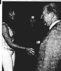
Πάνω: Ο Πρόεδρος της Δημοκρατίας Κ. Στεφανόπουλος με τον πρόεδρο της Βουλής των εφήβων Α. Σαμαράκη παρακολουθούν τις τελευταίες αγορεύσεις της συνόδου. Αριστερά: Αντιπροσωπεία της Βουλής των εφήβων συνομιλεί εγκάρδια με τον πρωθυπουργό Κ. Σημίτη.