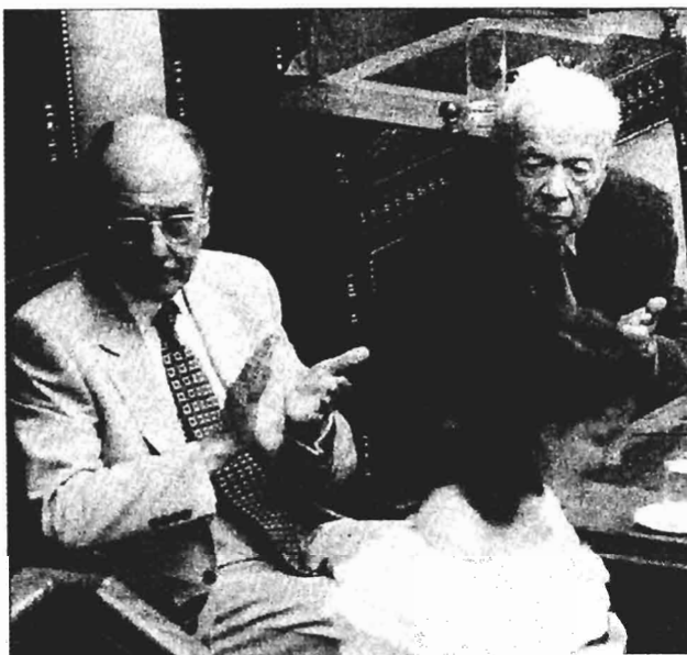
Ο Κωστής Στεφανόπουλος και ο Αντ. Σαμαράκης χειροκρότησαν με θέρμη τις ομιλίες των εφήβων

Σε φιλική συνομιλία που είχε με τους έφηβους βουλευτές, ο πρωθυπουργός ανέφερε ότι με