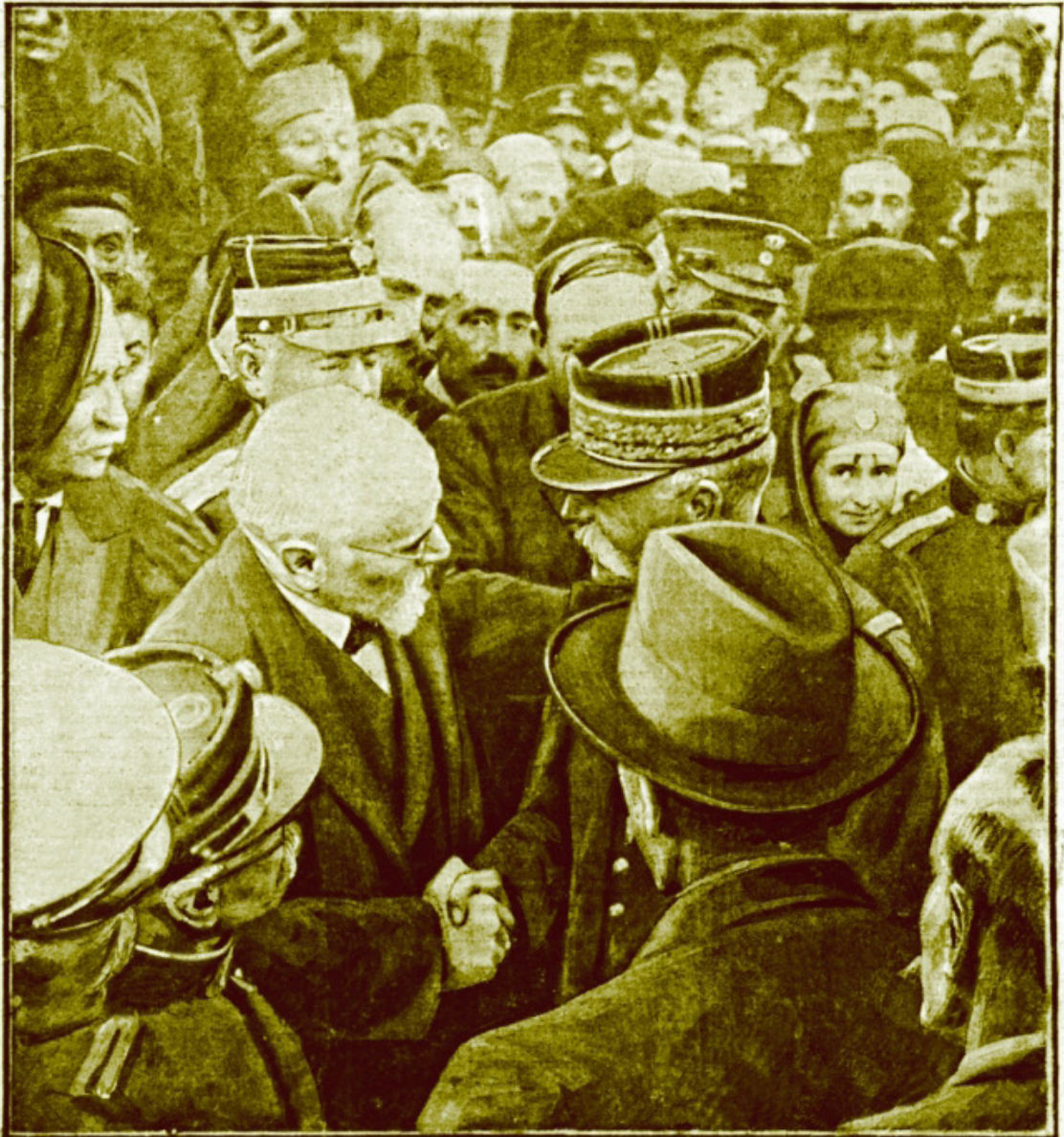
Voici le premier des documents publiés en France sur l'événement de si haute portée historique qui eut Salonique pour théâtre, le 9 octobre dernier, jour où M. Venizelos, chef du parti national, arriva dans cette ville. Le général Sarrail avait tenu à être l'un des premiers à saluer le grand Crétois au moment où il mit pied à terre. Et ce fut aux cris de : « Zito i Gallia! » — Vive la France! — que le chef des armées alliées traversa la foule et vint serrer la main du patriote hellène.

A Salonique. — La première poignée de main du général Sarrail à M. Venizelos