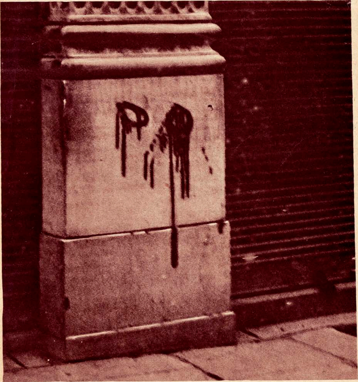
LA SAINT BARTHÉLEMY D'ATHÈNES : LE "SIGNE" QUI DÉSIGNAIT LES MAISONS DES VENIZELISTES Dans la nuit du 25 novembre, tandis que les soldats de Constantin tiraient sur nos marins, des individus à la solde des germanophiles marquaient ainsi les maisons des Venizelistes dont 150 au moins furent massacrés.

LE MIROIR paie n'importe quel prix les documents photographiques relatifs à la guerre, présentant un intérêt particulier.