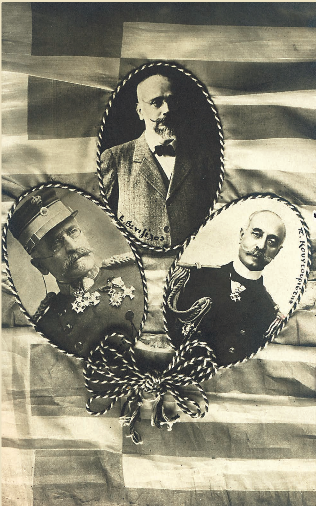
Η Τριανδρία της Θεσσαλονίκης, ο πρωθυπουργός Ελευθέριος Βενιζέλος, ο ναύαρχος Παύλος Κουντουριώτης και ο στρατηγός Παναγιώτης Δαγκλής