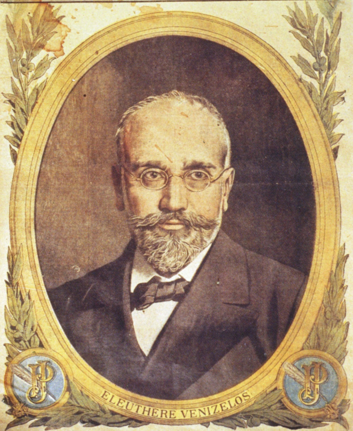
LE GRAND PATRIOTE GREC

UN AN 17 FR. DEUX ANS 32 FR. 50 DÉPARTEMENTS 4 FR. 50 ÉTRANGER 6 FR. 50