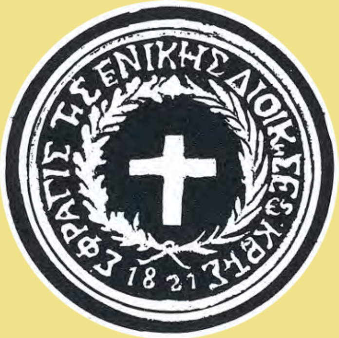
Σφραγίδα της Γενικής Διοικήσεως Κρήτης ἐπὶ ἐγγράφου τῆς 22ας Ἀπριλίου 1822, Πύργος Πλατανιάς Ἐθνικὸ Ἱστορικὸ Μουσεῖο

Εν Βόρειοι. Π. Τριουπολάου Δαόλαλας. Οι υάλοιαι εν Νήσου Κρήτης μέχρις αὐτῶν ἰσχυροὶ καὶ ἑτοιμοὶ εἰς ἐκστράτειαν ἀντιτάσσονται, ἔχοντες κατὰ τὴν ἑσπερίαν ἑσπερίαν τὰ ἴσχυρα, ἐπιτολὰς τῶν Δυνάμεων ἑσπερίαν εἰς τὴν 1821 ἐσπέρουσαν τὴν ἑσπερίαν ἑσπερίαν καὶ ἀποστολὰς αἰ μὲν τῶν ἑσπερίων Δυνάμεων ἑσπερίων τῶν ἑσπερίων Παραστάτων Δυνάμεων ἑσπερίων, κατὰ τὴν ἑσπερίαν τὴν ἑσπερίαν Δυνάμεων ἑσπερίων, καὶ τὴν ἑσπερίαν ἐπιτολὰς τῶν ἑσπερίων ἑσπερίων, ἐσπερίων μὲν ἐσπερίων. καὶ ἐσπερίων ἑσπερίων τῶν ἑσπερίων ἐσπερίων, τὴν ἑσπερίαν ἑσπερίων ἑσπερίων τῶν ἑσπερίων, τὴν ἑσπερίαν ἑσπερίων ἑσπερίων τῶν ἑσπερίων. Ἐν Ἀργεῖον, τῆς 20. Μαΐου 1822. Β. ἑσπερίαν τῶν ἑσπερίων. Προσωρινὸν Πολίτευμα τῆς Νήσου Κρήτης. Τῆς 20. Μαΐου 1822. Περὶ ἑσπερίων ἑσπερίων ἑσπερίων τῶν ἑσπερίων τῶν ἑσπερίων ἐσπερίων ἑσπερίων ἑσπερίων ἑσπερίων τῶν ἑσπερίων ἐσπερίων ἑσπερίων ἑσπερίων ἑσπερίων τῶν ἑσπερίων ἐσπερίων ἑσπερίων ἑσπερίων ἑσπερίων τῶν ἑσπερίων ἐσπερίων ἑσπερίων ἑσπερίων ἑσπερίων τῶν ἑσπερίων