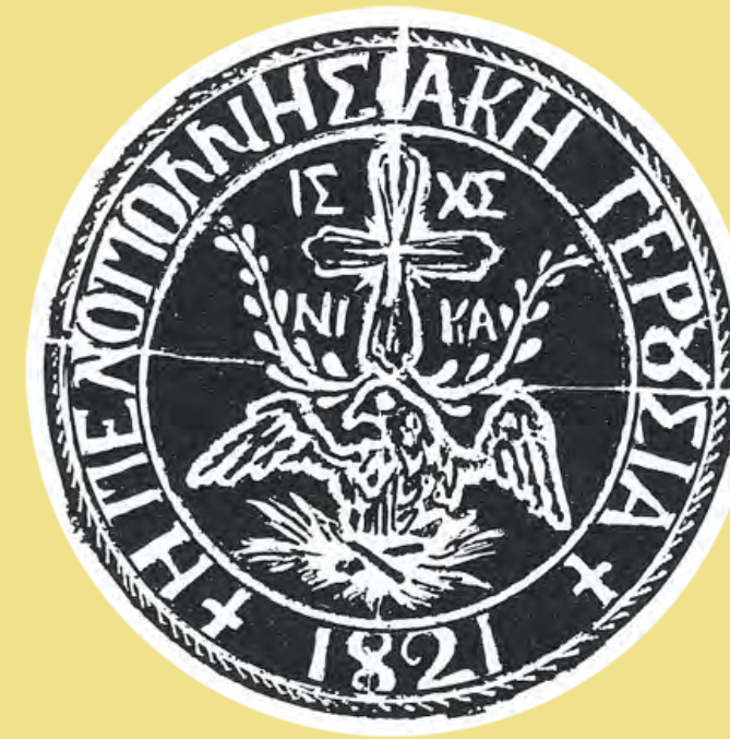
Σφραγίδα της Πελοποννησιακής Γερουσίας, σε έγγραφο της 10ης Αυγούστου 1822, Τριπολιτσά Εθνικό Ιστορικό Μουσείο

Η Πελοποννησιακή Γερουσία συστάθηκε σε συνέλευση των 37 περίπου επιφανέστερων ιεραρχών, προκρίτων και σπλαρχηγών της περιοχής στη μονή των Καλτετζών (π. 20-26 Μαΐου 1821). Πρόεδρός της ορίστηκε ο αρχιστράτηγος της Πελοποννήσου Πετρόμπεης Μαυρομιχάλης ο οποίος θα συνεπικουρούνταν από άλλα έξι μέλη. Η Γερουσία θα είχε έκτακτες εξουσίες μέχρι την αναμενόμενη πτώση της Τριπολιτσάς. Η άφιξη του Δημητρίου Υψηλάντη τον Ιούνιο και η πόλωση των σχέσεων στρατιωτικών και προκρίτων κατέστησαν αυτό το σώμα πεδίο ισχυρών πολιτικών αντιπαραθέσεων που οι διαδοχικές συνελεύσεις δεν κατόρθωσαν να αμβλύνουν. Έτσι, η οριστική του συγκρότηση κατέληξε να καθορίζεται στο Άργος και την Επίδαυρο (1-27 Δεκεμβρίου 1821) σχεδόν παράλληλα με τις εργασίες της Εθνοσυνέλευσης.