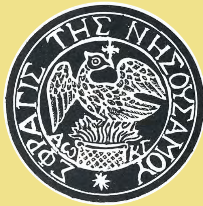
Σφραγίδα της Νήσου Σάμου επί εγγράφου της 18ης Δεκεμβρίου 1822 Εθνικό Ιστορικό Μουσείο

ζ. Νὰ διορίῃ τὸν ἀστυνόμον, τὸν λιμενάρχην, τοὺς τελῶνας καὶ ὅλας τὰς παραβαλασσίας καὶ λοιπὰς φυλακὰς τῆς πατρίδος, τὰς ὁποίας ἔχει τὸ δικαίωμα τὰ ἐλαττώσῃ καὶ ἀυξάνῃ κατὰ τὰς περι- στάσεις.