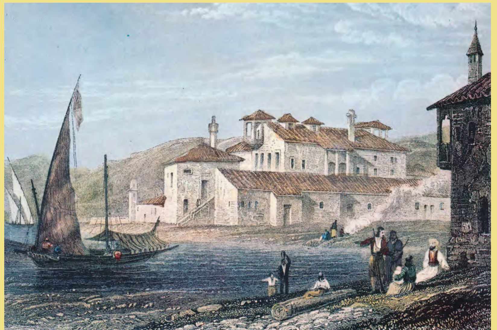
W. Purser, Το Μεσολόγγι στις αρχές του 19ου αιώνα, ἐγχρωμη λιθογραφία Βιβλιοθήκη της Βουλῆς των Ελλήνων

Ὁργανισμὸς τῆς Γερουσίας τῆς Δυτικῆς Χέρσου Ἑλλάδος, Μεσολόγγι, 9 Νοεμβρίου 1821 ἀπό: Ἀνδρέας Μάμουκας (επιμ.), Τα κατὰ τὴν Αναγέννησιν τῆς Ἑλλάδος, τ. Α', Πειραιᾶς 1839 Βιβλιοθήκη τῆς Βουλῆς των Ελλήνων