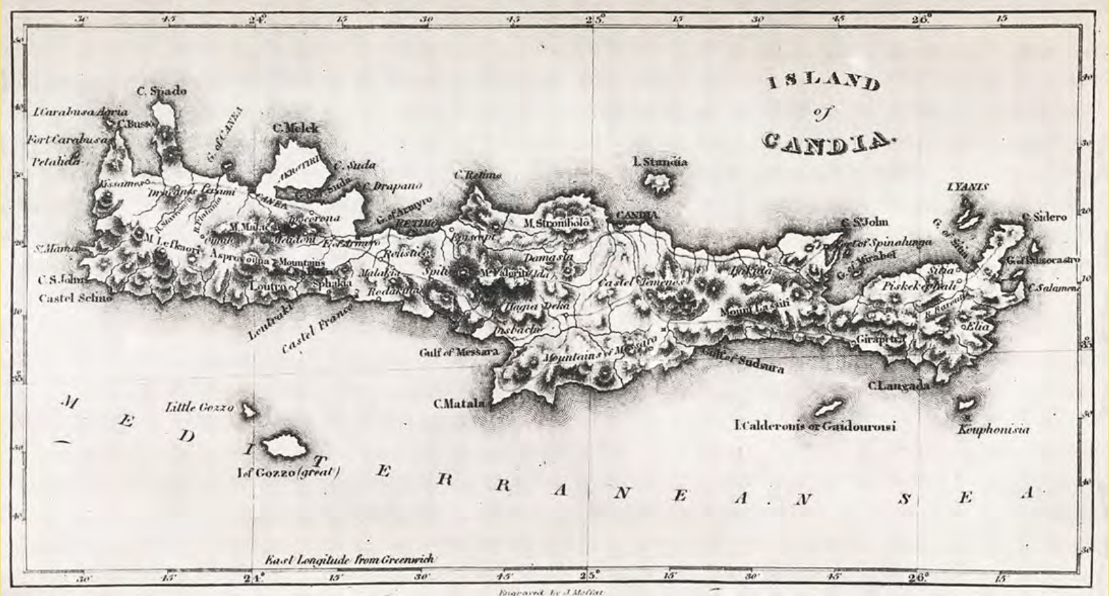
Χάρτης τῆς Κρήτης στα χρόνια τῆς Ἐπανάστασης ἀπὸ: Thomas Gordon, History of the Greek Revolution , Λονδίνο 1832 Βιβλιοθήκη τῆς Βουλῆς τῶν Ἑλλήνων