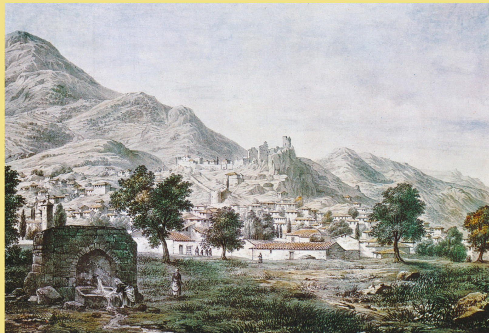
G. Holland, Τα Σάλωνα και το κάστρο τους στις αρχές του 19ου αιώνα, έγχρωμη λιθογραφία από: Γεώργιος Τσούλιος (επιμ.), Ιστορικόν Λεύκωμα της Ελληνικής Επανάστασεως , τ. 1, εκδόσεις Μέλισσα, Αθήνα 1970