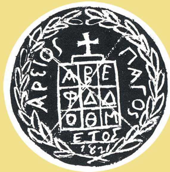
Τετραμερής σφραγίδα του Αρείου Πάγου Επί εγγράφου της 29ης Μαρτίου 1822, Λιθάδα Ευβοίας Εθνικό Ιστορικό Μουσείο