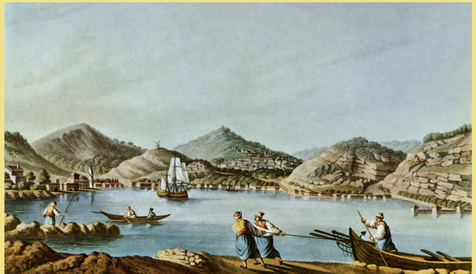
Luigi Mayer, Το λιμάνι και η Χώρα Βαθέος της Σάμου στα τέλη του 18ου αιώνα, υδατογραφία σε σχέδιο Robert Ainslie

από: Luigi Mayer, Views in the Ottoman Dominions in Europe, in Asia and some of the Mediterranean islands , Λονδίνο 1810