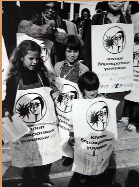
Σημειώματα από τη συγκέντρωση διαμαρτυρίας γυναικείου οργανώσεων για την αναμόρφωση του Οικογενειακού Δικαίου. Μετά το τέλος της πορείας η Επιτροπή Αγώνα επέδωσε γραπτή διαμαρτυρία στο ελληνικό κοινοβούλιο, 6 Οκτωβρίου 1980