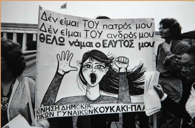
Σημειώματα από τη συγκέντρωση στα προπύλαια του Πανεπιστημίου της Αθήνας με αφορμή την Ημέρα της Γυναίκας, 8 Μαρτίου 1981