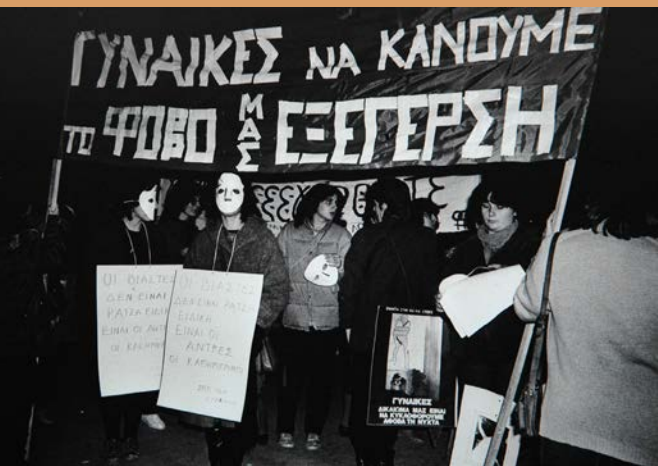
Σημειώματα από τη διαδήλωση κατά των βιασμών, με αφορμή βιασμό στην περιοχή Φιλοπάππου, 3 Δεκεμβρίου 1981