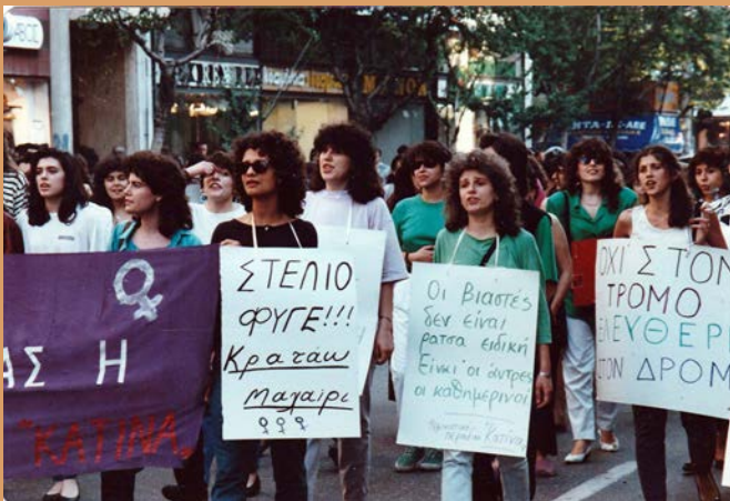
Διαδήλωση στη Θεσσαλονίκη Αρχείο περιοδικού Κατίνα