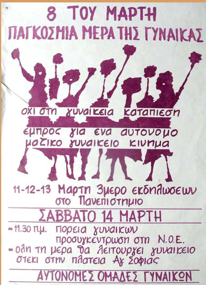
Αφίσσα των Αυτόνομων Ομάδων Γυναικών, για τις εκδηλώσεις που οργανώθηκαν με αφορμή την Ημέρα της Γυναίκας, 11-14 Μαρτίου 1981 Γενική Γραμματεία Ισότητας των Φύλων, Βιβλιοθήκη Θεμάτων Ισότητας των Φύλων