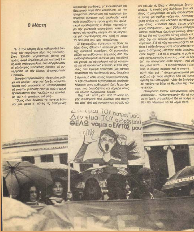
Άρθρο του περιοδικού Σφίγγα για τη συγκέντρωση με αφορμή την Ημέρα της Γυναίκας στις 8 Μαρτίου 1980 Από: Σφίγγα, τχ. 1, Ιούλιος 1980