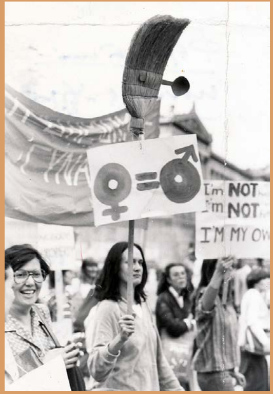
Φυλλάδιο κατά των γυναικείων καλλιστείων, Μάιος 1981 Αρχείο Γυναικών «Δελφύς»