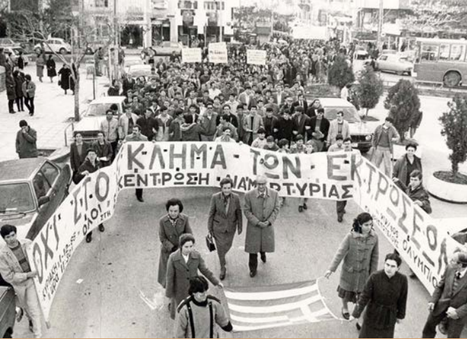
Διαδήλωση ενάντια στις φεμινιστικές διεκδικήσεις για τη νομιμοποίηση της έκτρωσης. Θεσσαλονίκη, 2 Δεκεμβρίου 1985