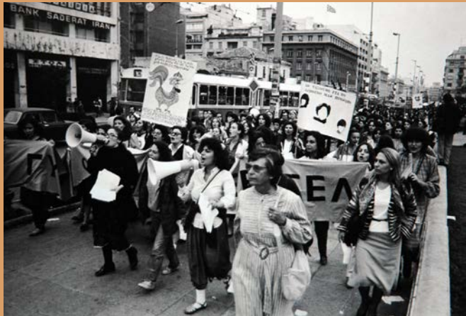
Σημειώματα από τη συγκέντρωση στα προπύλαια του Πανεπιστημίου της Αθήνας με αφορμή την Ημέρα της Γυναίκας, 8 Μαρτίου 1981