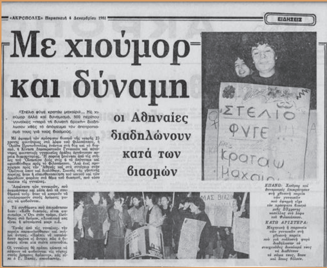
Δημοσίευμα σχετικά με την πορεία καταγγελίας βιασμού στην περιοχή Φιλοπάππου, 4 Δεκεμβρίου 1981