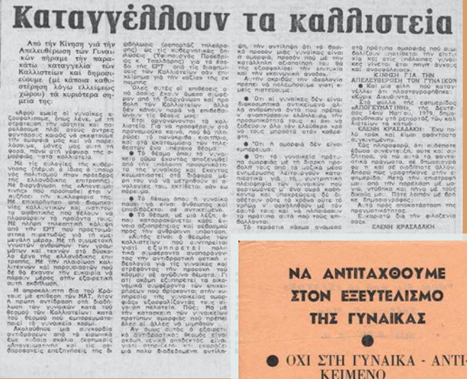
«Καταγγέλλουν τα καλλιστεία», επιστολή της Κίνησης για την Απελευθέρωση των Γυναικών μετά τα επεισόδια στη διαμαρτυρία που οργανώθηκε στο πλαίσιο των γυναικείων καλλιστείων, Μάιος 1978