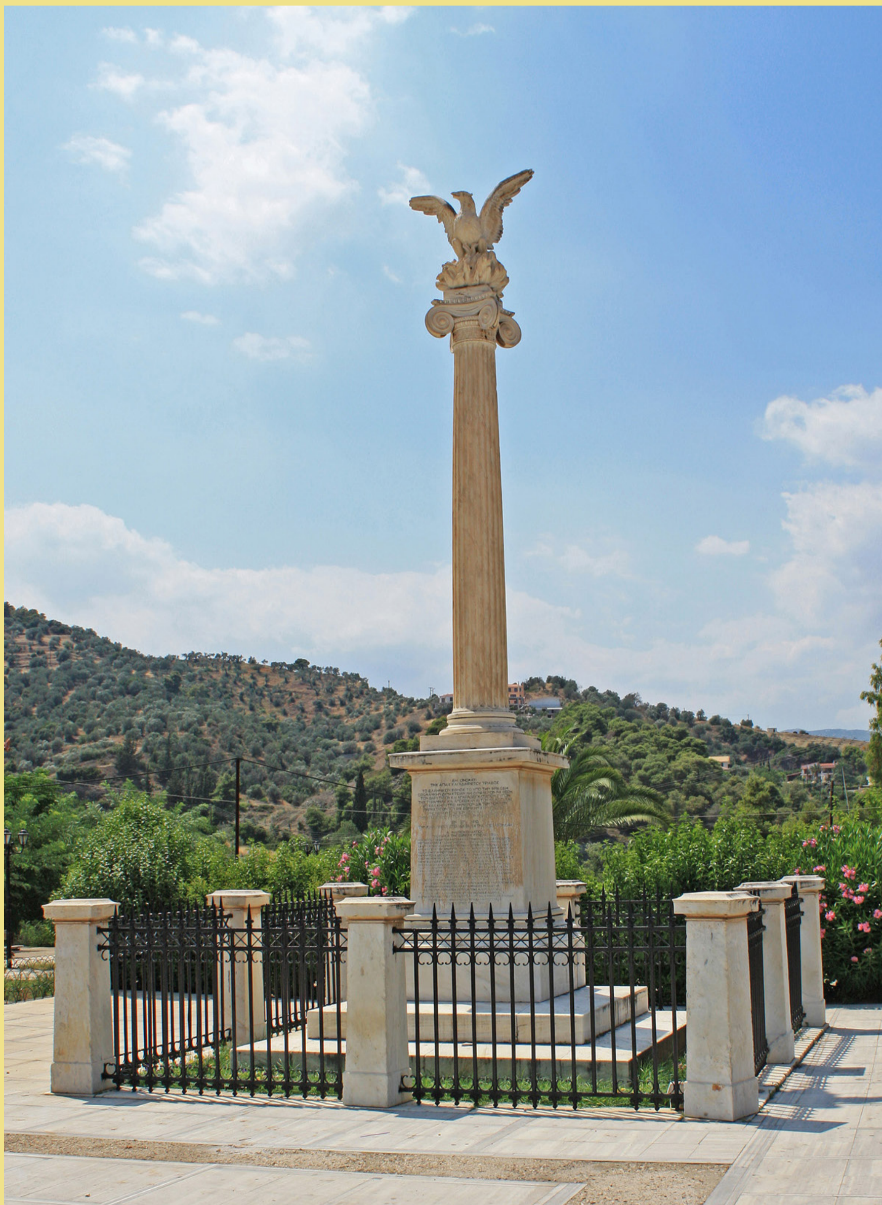
Άποψη της αναθηματικής στήλης σήμερα