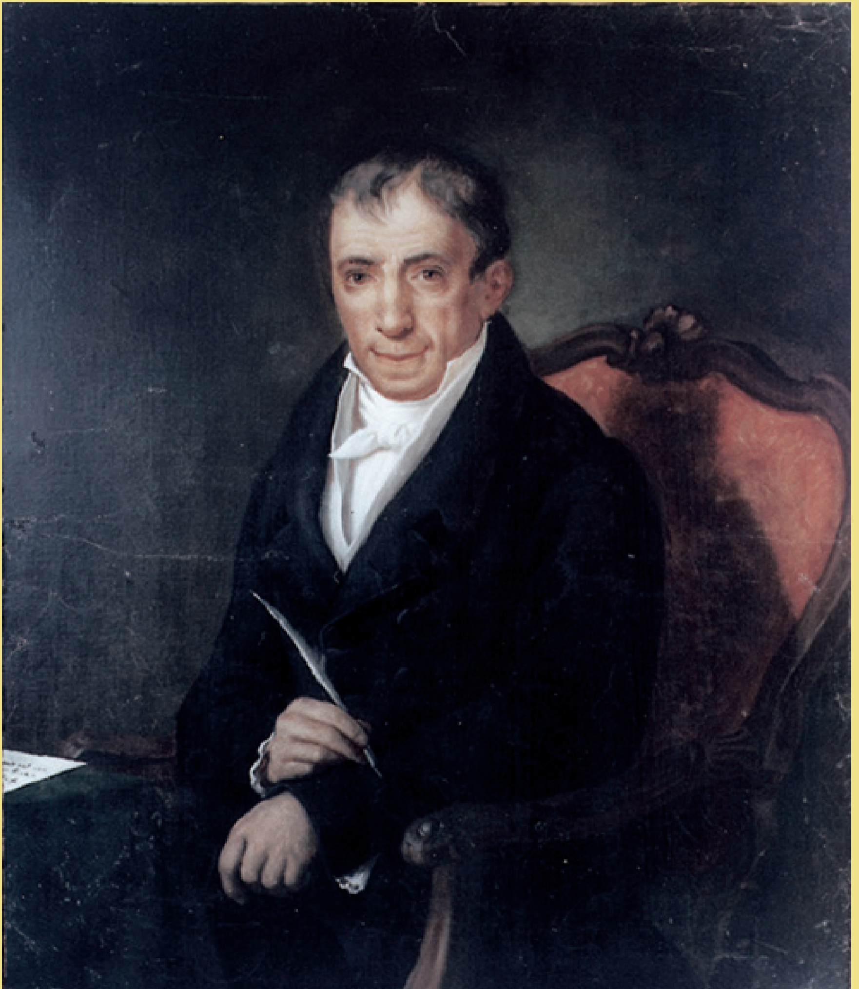
Αδαμάντιος Κοραής, ελαιογραφία Εθνικό Ιστορικό Μουσείο

Εισηγείτο τη χρήση σχολικών βιβλίων γραμμένων στην κοινήν γλώσσαν καθώς και την ένταξη της Ιστορίας, της Γεωγραφίας αλλά και του Συντάγματος της Ελληνικής Πολιτείας στη διδακτέα ύλη.