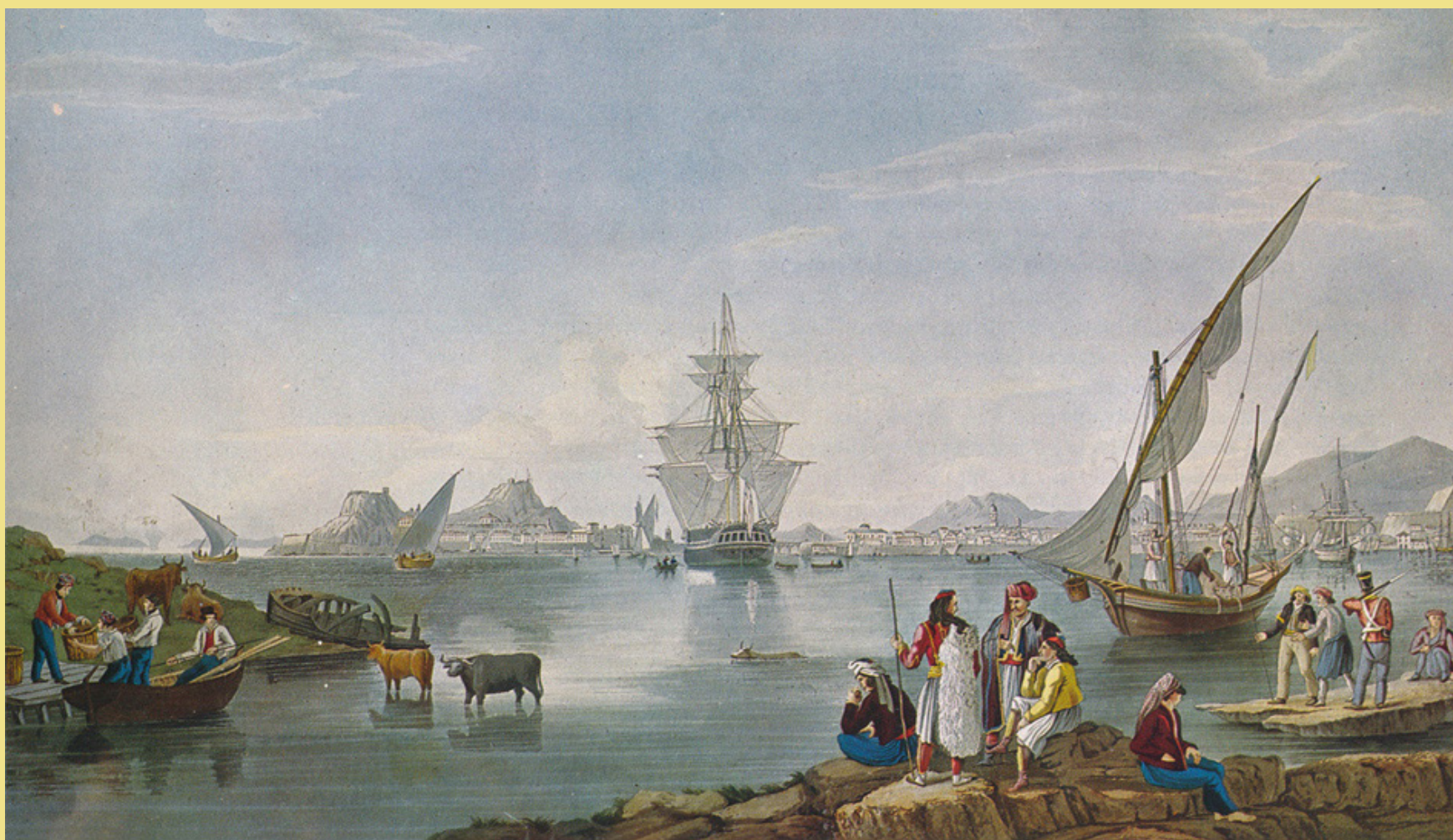
R. Havell, Η πόλη, το φρούριο και το λιμάνι της Κέρκυρας, έγχρωμη λιθογραφία σε σχέδιο J. Cartwright από: Γεώργιος Τσούλιος (επιμ.), Ιστορικόν Λεύκωμα της Ελληνικής Επανάστασεως , τ. 1, εκδόσεις Μέλισσα, Αθήνα 1970

Η μεγαλειώδης Χάρτα της Ελλάδος αποτελείται από 12 φύλλα διαστάσεων το καθένα 50X70 εκ. περίπου, που αν συνενωθούν, δημιουργείται ένας, για πρώτη φορά τέτοιων διαστάσεων (2μ.Χ2μ.), χάρτης του βαλκανικού χώρου. Η Χάρτα της Ελλάδος είναι πολιτικός χάρτης του δημοκρατικού κράτους, το οποίο οραματιζόταν ο Ρήγας ότι θα δημιουργηθεί μετά από επανάσταση. Σκοπός του ήταν να αντικαταστήσει την οθωμανική πολιτική διαίρεσή του χώρου και να χρησιμοποιήσει τα αρχαία τοπωνύμια. Το χαρτογραφικό έργο του Ρήγα εντάσσεται στο επαναστατικό του σχέδιο για τη δημιουργία της Νέας Πολιτικής Διοικήσεως , του αντιπροσωπευτικού δημοκρατικού κράτους, που θα αντικαθιστούσε την απολυταρχική οθωμανική εξουσία.