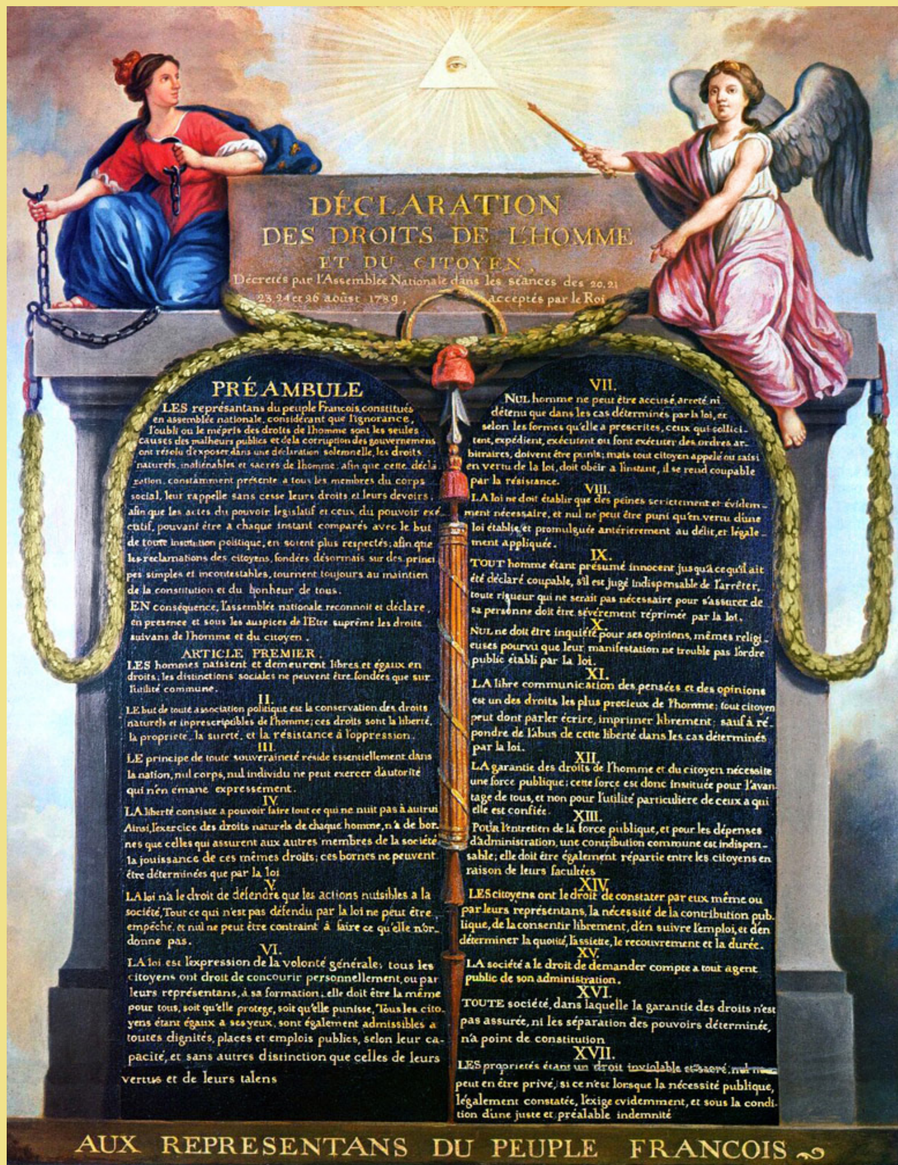
Η Διακήρυξη των Δικαιωμάτων του Ανθρώπου και του Πολίτη, Παρίσι, 26 Αυγούστου 1789

Έναυσμα αφύπνισης και «εργαστήριο ιδεών» για τους λαούς της Ευρώπης, η Γαλλική Επανάσταση έχει πλούσιο συνταγματικό απολογισμό, με τρία Συντάγματα και ισάριθμες διακηρύξεις των δικαιωμάτων του Ανθρώπου και του Πολίτη. Η Διακήρυξη του 1789 περιείχε το προοίμιο και 17 συνολικά άρθρα με διατάξεις δύο ειδών. Από τη μια είχε κατάλογο των κυριότερων ατομικών δικαιωμάτων και από την άλλη, τις οργανωτικές αρχές βάσει των οποίων θα καταρτιζόνταν το μελλοντικό Σύνταγμα της χώρας. Δεν απευθυνόταν μόνο στους Γάλλους πολίτες αλλά γενικά σε όλους τους ανθρώπους. Η μοναδικότητα της Γαλλικής Διακήρυξης βρίσκεται στον ιδιοφυή συνδυασμό της πίστης ότι τα δικαιώματα ενυπάρχουν στην ανθρώπινη φύση και ότι ο νόμος αποτελεί την καλύτερη εγγύηση για το σεβασμό τους.