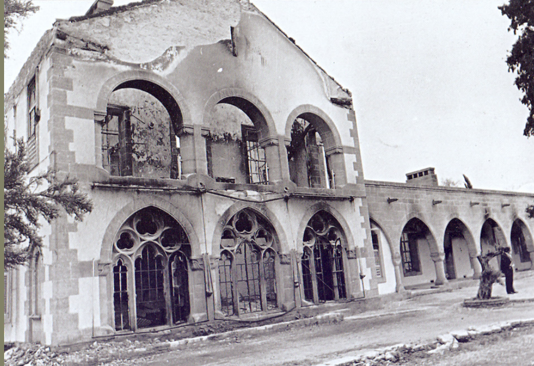
Το Προεδρικό Μέγαρο βομβαρδισμένο μετά το υποκινούμενο από την Αθήνα πραξικόπημα του Νίκου Σαμψών. Λευκωσία, 15 Ιουλίου 1974.