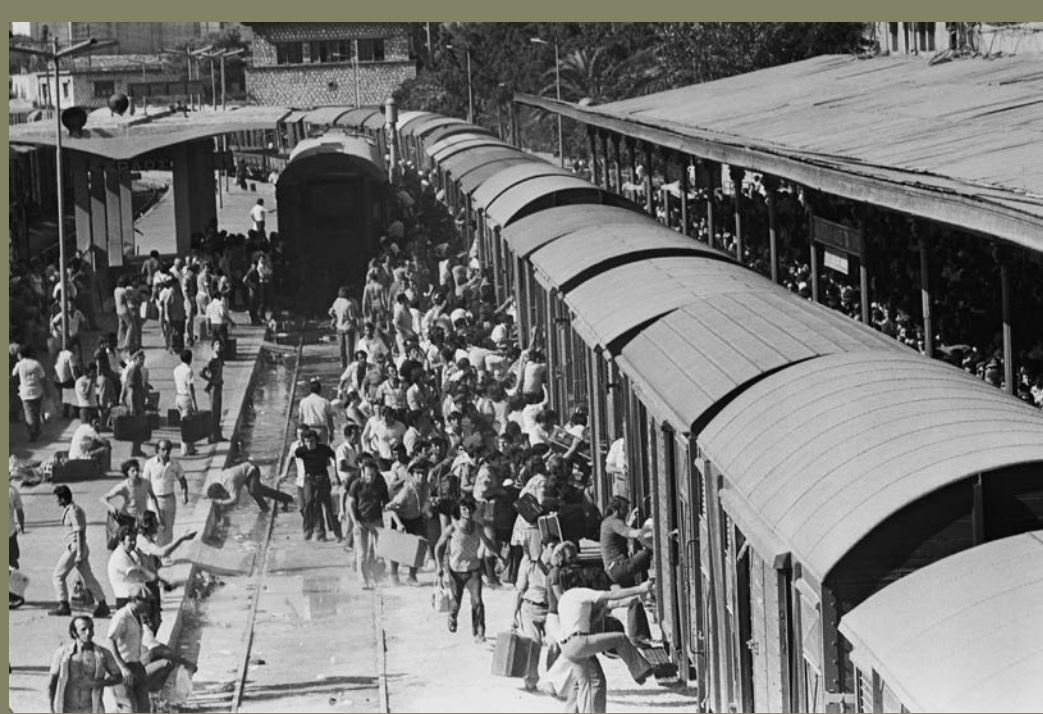
Επιστράτευση Ελλήνων εφέδρων μετά την πρώτη τουρκική εισβολή στην Κύπρο (ΑΤΙΛΑΣ Ι), 20-22 Ιουλίου 1974.