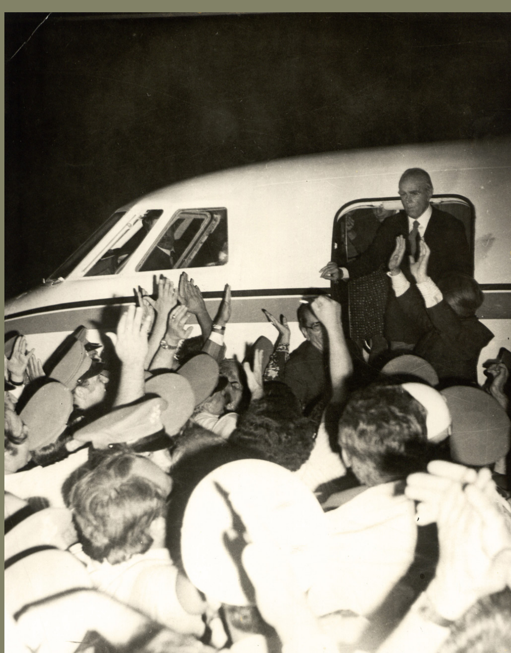
Ο Κωνσταντίνος Καραμανλής καταφθάνει στο Αεροδρόμιο του Ελληνικού, 24 Ιουλίου 1974