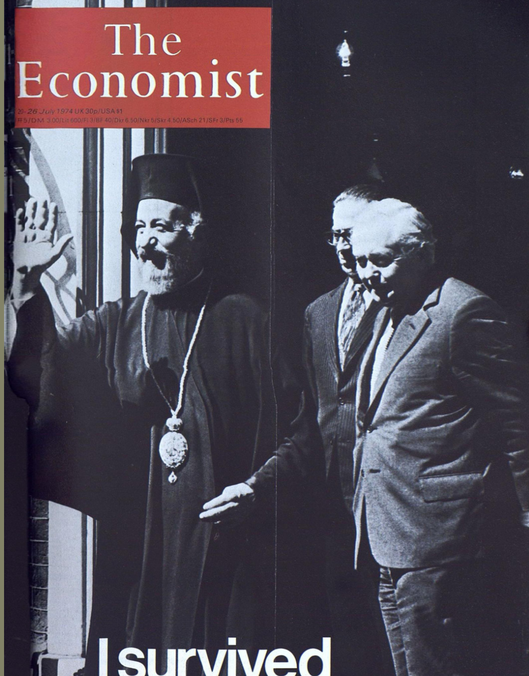
Ο πρόεδρος της Κυπριακής Δημοκρατίας, αρχιεπίσκοπος Μακάριος, μετά τη διαφυγή του από την Κύπρο, συναντά τον Βρετανό πρωθυπουργό Χάρολντ Γουίλσον (Harold Wilson) στο Λονδίνο, περιοδικό Economist, Ιούλιος 1974. Βιβλιοθήκη της Βουλής των Ελλήνων