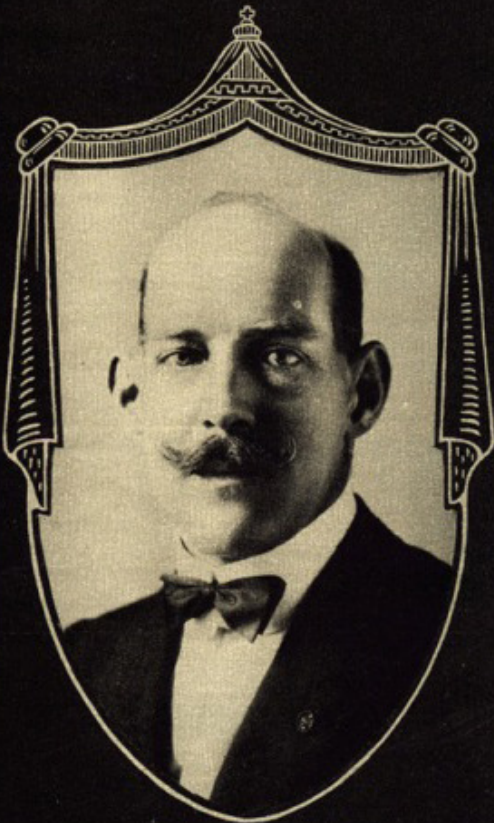
King Constantine of Greece.