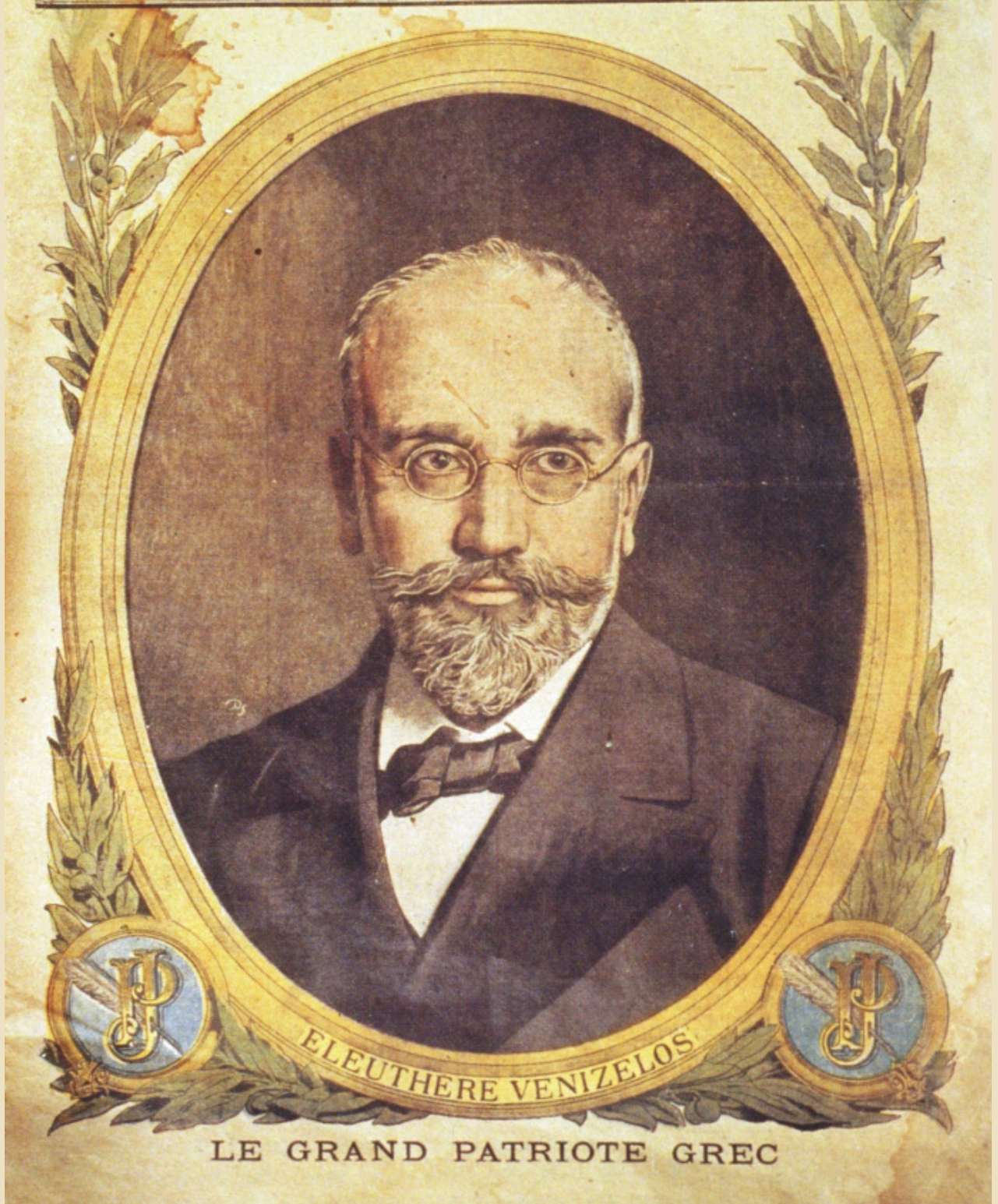
Portrait of Venizelos on the cover of Le Petit Journal , 29 October 1916