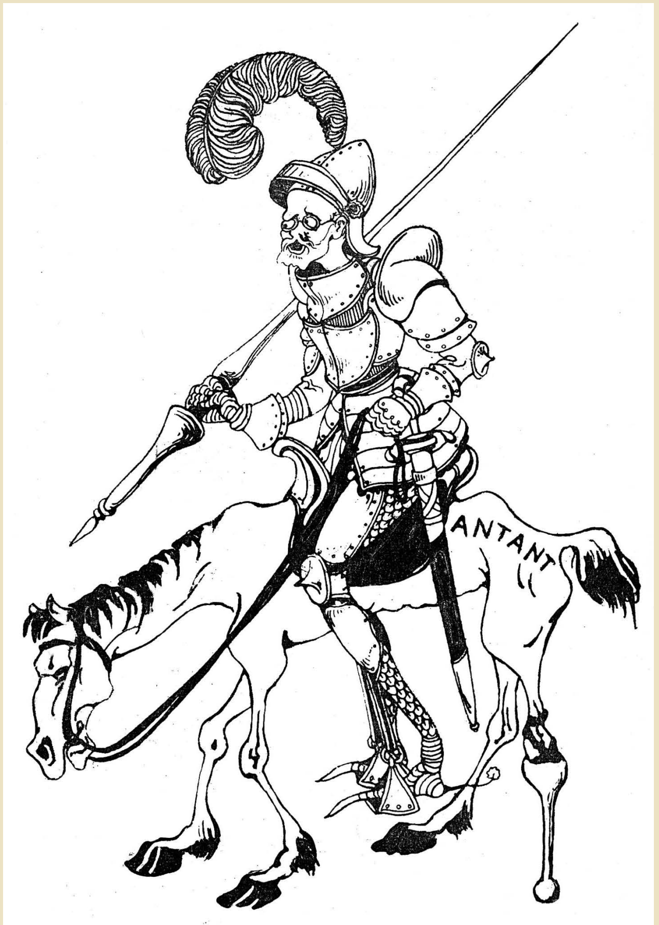
Venizelos in a caricature of the time portrayed as Don Quixote