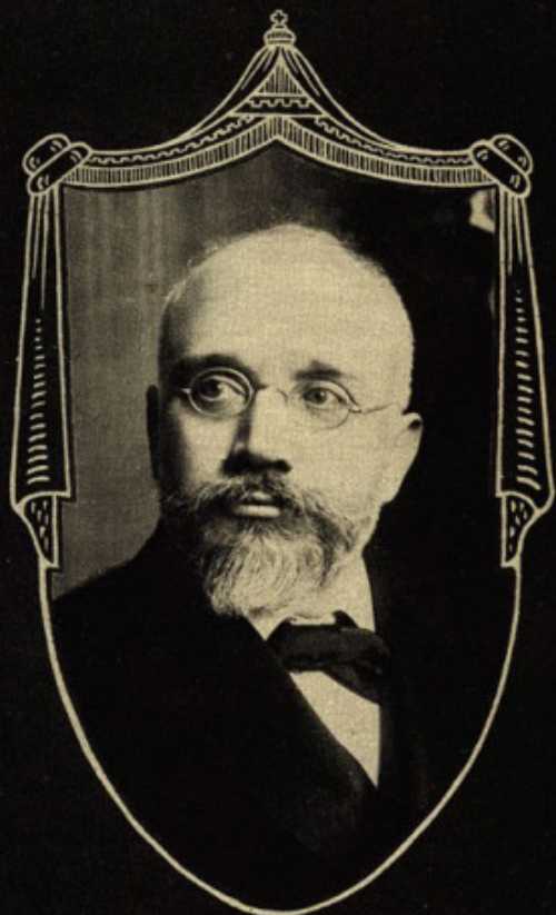
M. Venizelos, former Greek Premier.