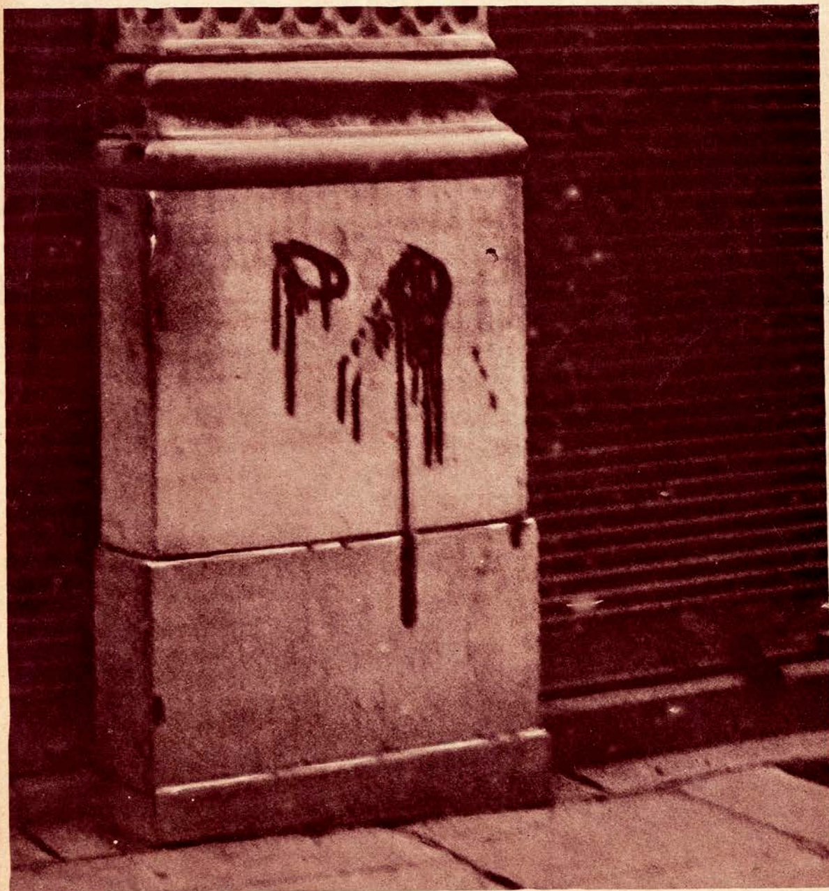
LA SAINT BARTHÉLEMY D'ATHÈNES : LE " SIGNE " QUI DÉSIGNAIT LES MAISONS DES VENIZELISTES

LE MIROIR paie n'importe quel prix les documents photographiques relatifs à la guerre, présentant un intérêt particulier.