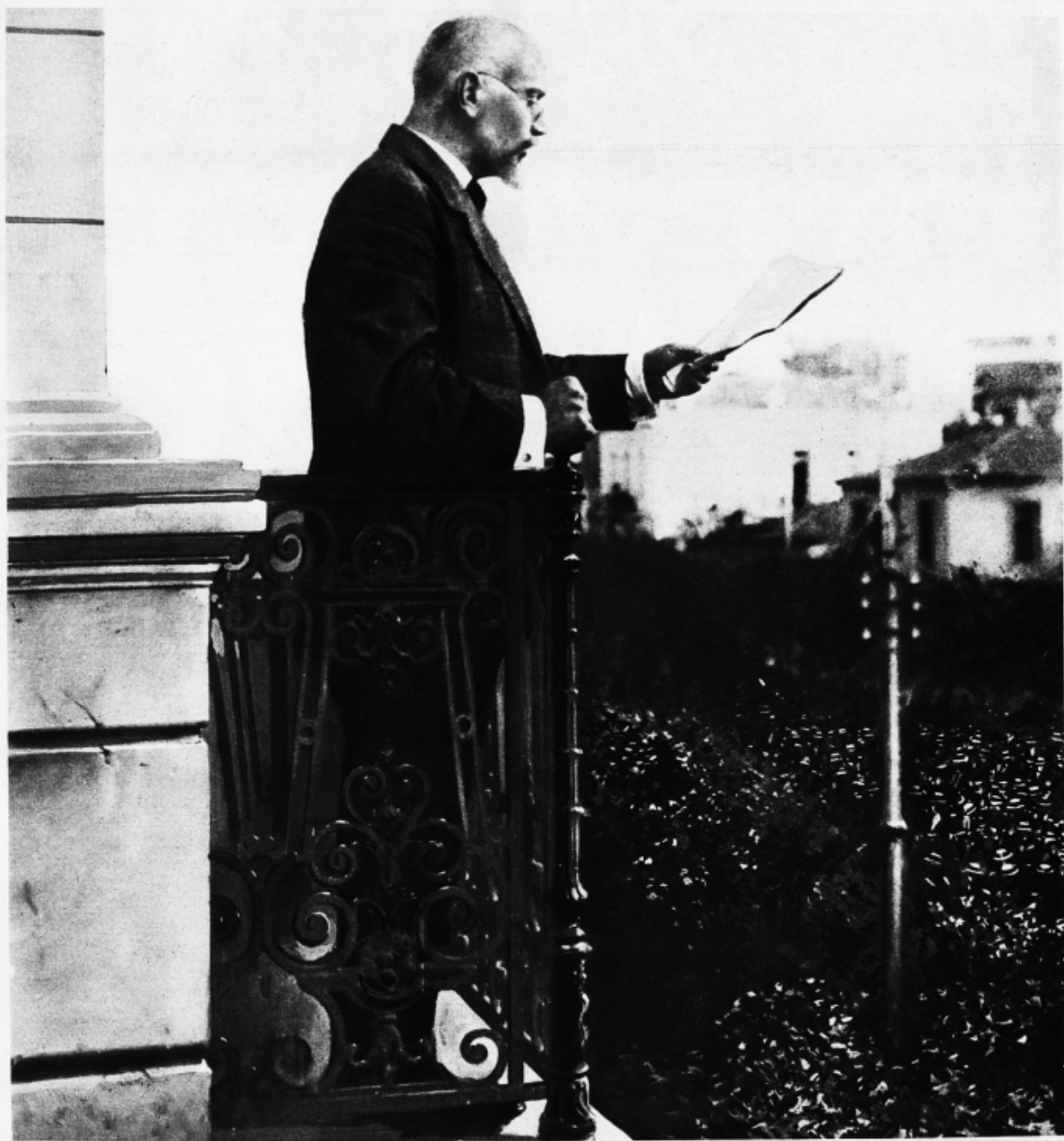
M. VENIZELOS LIT LE DÉCRET REMIS AU ROI PAR UNE COMMISSION DU PEUPLE

LE MIROIR paie n'importe quel prix les documents photographiques relatifs à la guerre, présentant un intérêt particulier.