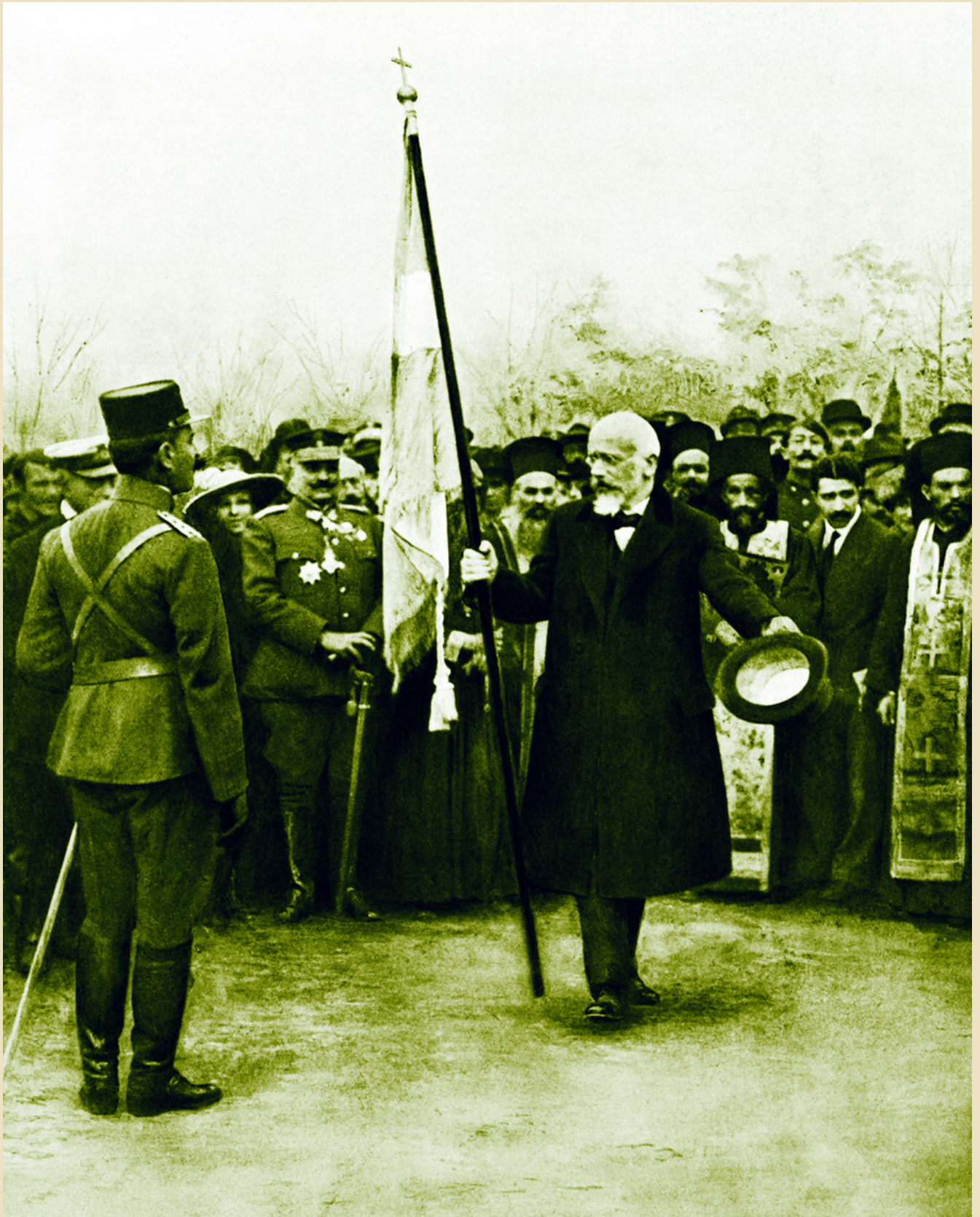
Venizelos formed an army from regions belonging to the Government of Thessaloniki. In the picture, he delivers the Greek flag to the Commander of the Serres division before its departure for the Macedonian front, December 9, 1916