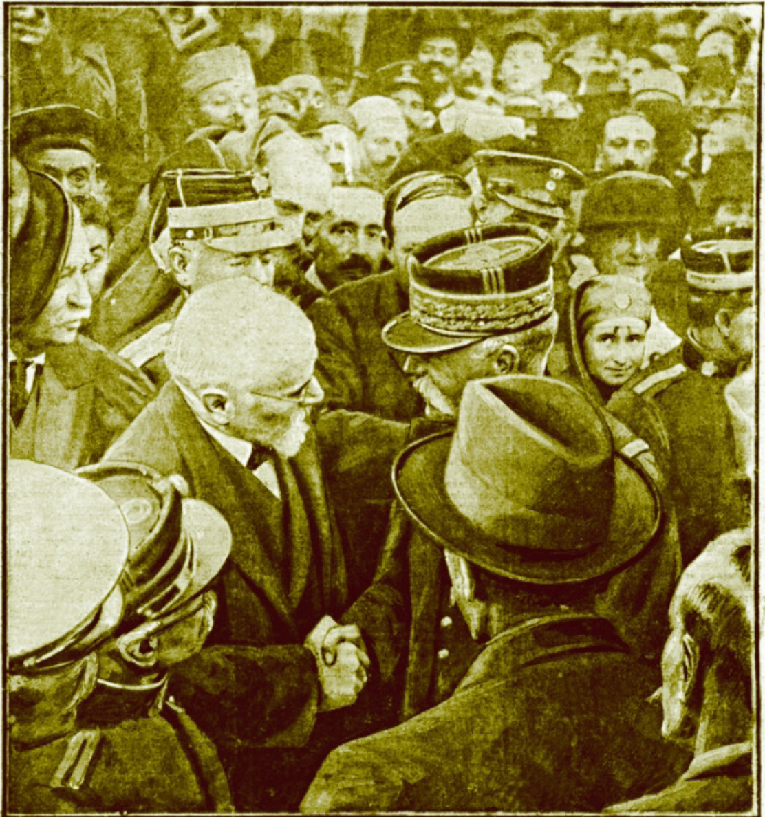
Voici le premier des documents publiés en France sur l'événement de si haute portée historique qui eut Salonique pour théâtre, le 9 octobre dernier, jour où M. Venizelos, chef du parti national, arriva dans cette ville. Le général Sarrail avait tenu à être l'un des premiers à saüer le grand Crétois au moment où il mit pied à terre. Et ce fut aux cris de : « Zito i Gallia! » — Vive la France! — que le chef des armées alliées traversa la foule et vint serrer la main du patriote hellène.

A Salonique. — La première poignée de main du général Sarrail à M. Venizelos